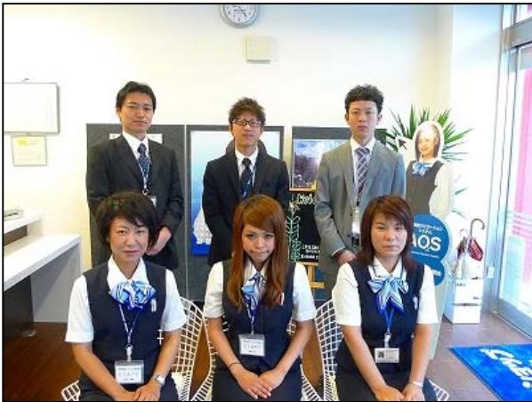
皆様のご来店心よりお待ちしております！ 金沢駅前店 スタッフ一同